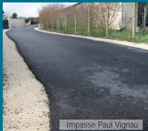
Impasse Paul Vignau