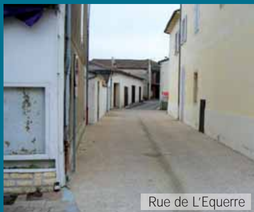
Rue de L'Equerre