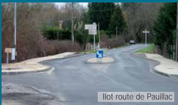
Ilot route de Pauillac