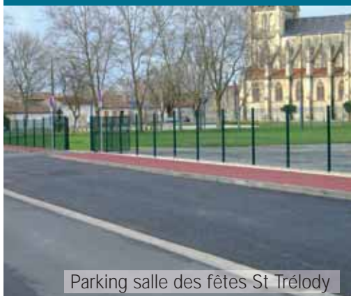
Parking salle des fêtes St Tréloody