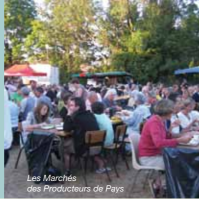
Les Marchés des Producteurs de Pays